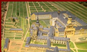
Maquette de l'abbaye telle qu'elle se présentait peu avant la Révolution française.

On note la présence de religieux dès 1070. Mathilde de Toscane séjourna dans nos régions en 1072 et 1073. Elle aurait marqué son appui aux religieux par le financement de leur église. Elle laisse aussi une belle légende qui ravit les visiteurs : celle de la truite et l'anneau.