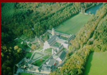
Relevée de ses cendres, elle est habitée à nouveau par une communauté cistercienne.